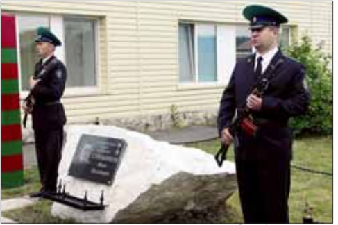
В почётном карауле.