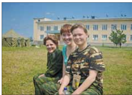
Елена с подругами.

Согласно материалам российских федеральных и региональных СМИ: «В августе 2008 получили ранения около 250 российских военнослужащих. С 1 по 31 августа 2008 года как на южноосетинском, так и на абхазском направлениях всего удалось идентифицировать 65 погибших российских военнослужащих».