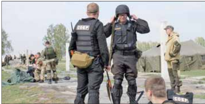
«Спец» готовится выполнять упражнения по скоростной стрельбе.