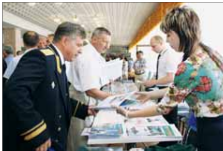
Выставка-продажа организована КЖИ «Граница».

На третий день праздничных мероприятий в городском парке «Победа» состоялась возложение цветов к обелиску пограничникам. Затем состоялось показательное выступление военнослужащих пограничных органов и была развёрнута выставка техники и вооружения. Завершились мероприятия выступлением творческих пограничных коллективов. ☐