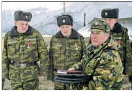
Награждение участников операции в Аргинском ущелье.

В 1963 году пограничные округа юга России объединились в один, Закавказский. Следом произошло и слияние газет. Штаб округа располагался в Тбилиси. Там же находилась и редакция