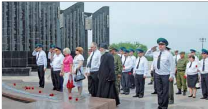
У мемориала воинам-интернационалистам на площади Славы.