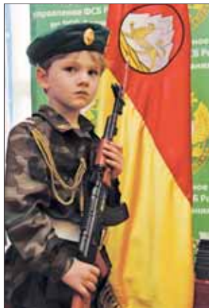
Буду как папа!

...12 июля в пресс-центре ГТРК «Ставрополь» прошла пресс-конференция начальника Южного регионального пограничного управления ФСБ России генерал-полковника Н.Лисинского. Отвечая на вопросы представителей печатных и электронных средств массовой информации, Николай Павлович отметил, что сегодня пограничные органы юга России являются одним из ключевых элементов системы обеспечения национальной безопасности в регионе.