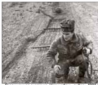
Разрушенная система. Нахичевань, январь 1990 г.