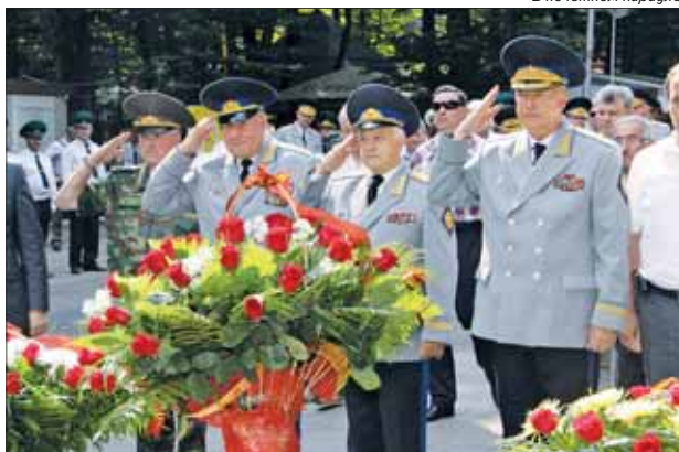
Возложение цветов к обелиску пограничникам.

Результаты оперативно-служебной деятельности — яркое тому подтверждение. За первое полугодие текущего года задержано более 100 нарушителей границы, свыше 1500 нарушителей пограничного режима. К пересечению госграницы оформлено около 9 млн. граждан и свыше одного миллиона транспортных средств. В сфере охраны водных биоресурсов у правонарушителей изъято более 140 маломощных плавсредств, около 120 руль-моторов, свыше 400 км сетей, 13 тонн морепродуктов.