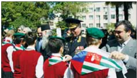
Поздравление юных друзей пограничников.