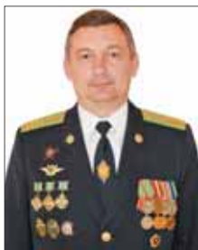
Валерий Павлович Резниченко, начальник Пограничного управления ФСБ России в Республике Южная Осетия.

— Развитие пограничной инфраструктуры — это, безус-