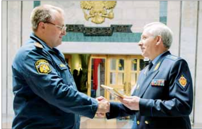
Генерал-полковник Вячеслав Дорохин награждает участника акции.

ТЕМА НОМЕРА: ВЗАИМОПОМОЩЬ. СОТРУДНИЧЕСТВО. БЕЗОПАСНОСТЬ