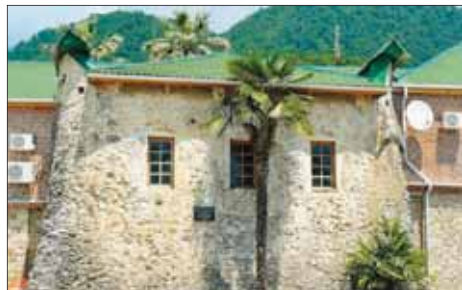
Генуэзская башня XIII века.