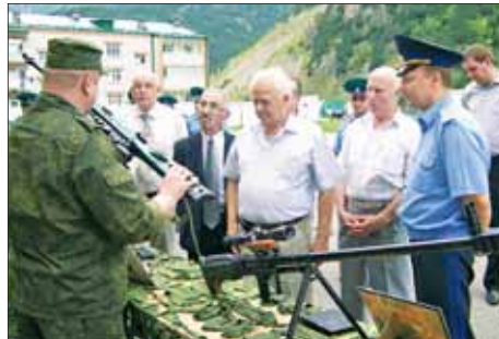
На заставе имени Героя Советского Союза В.Матросова.