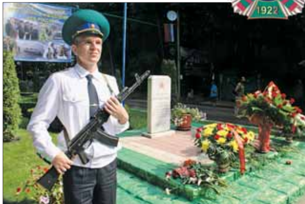
В почётном карауле.